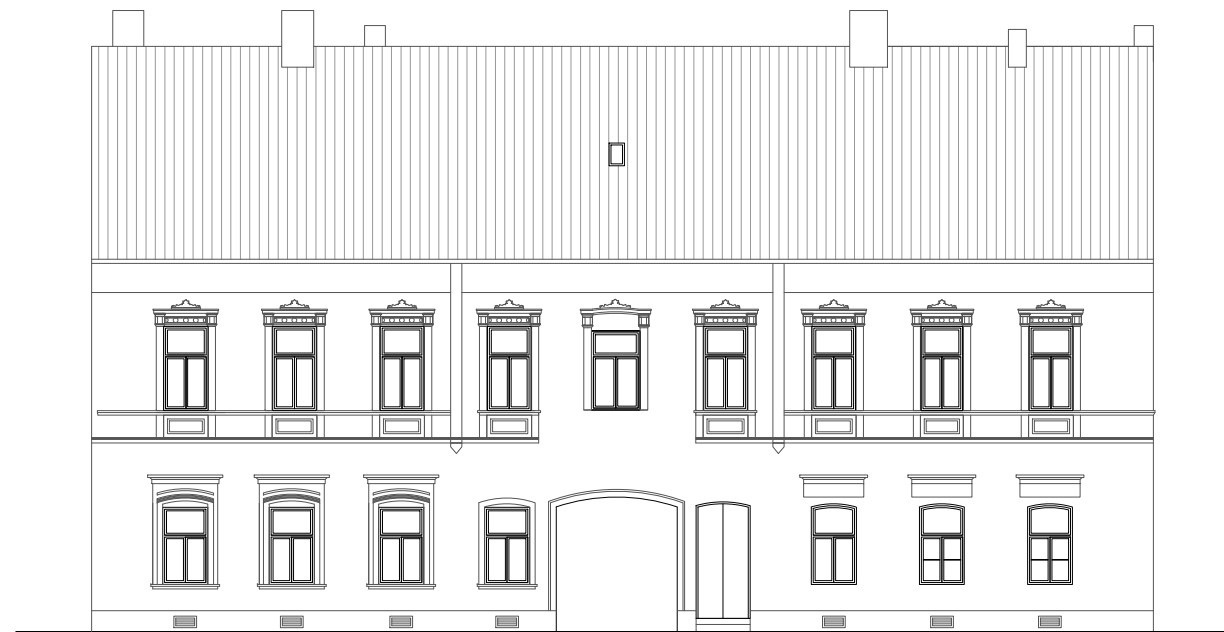
JUŽNO PROČELJE (ULIČNO)